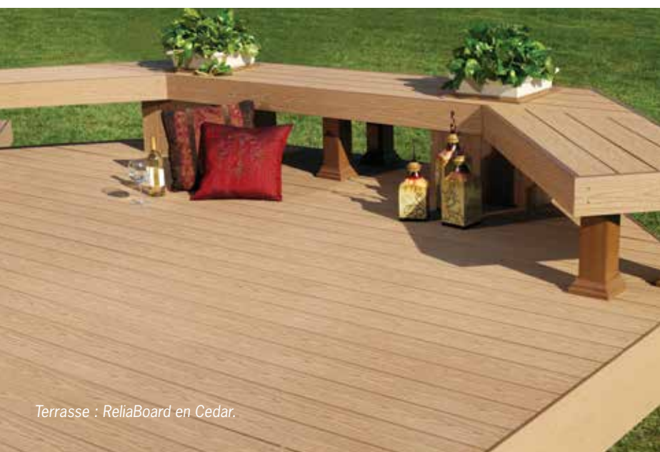
Terrasse : ReliaBoard en Cedar.