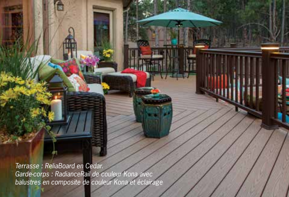
Terrasse : ReliaBoard en Cedar. Garde-corps : RadianceRail de couleur Kona avec balustres en composite de couleur Kona et éclairage