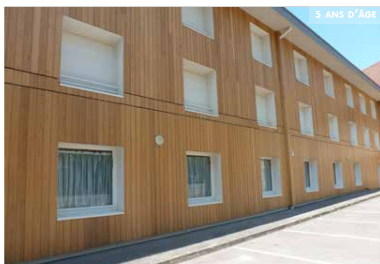
Mèlèze de sibérie - Linéa - soleil 301 - 21x150 - Selongey (21)