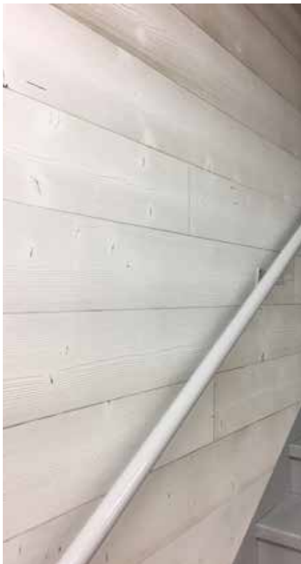
Épicéa du Nord, EcoThermo intérieur - Micro 1 - 19x185 - cérusé blanc 601 - Haute-Savoie (74)