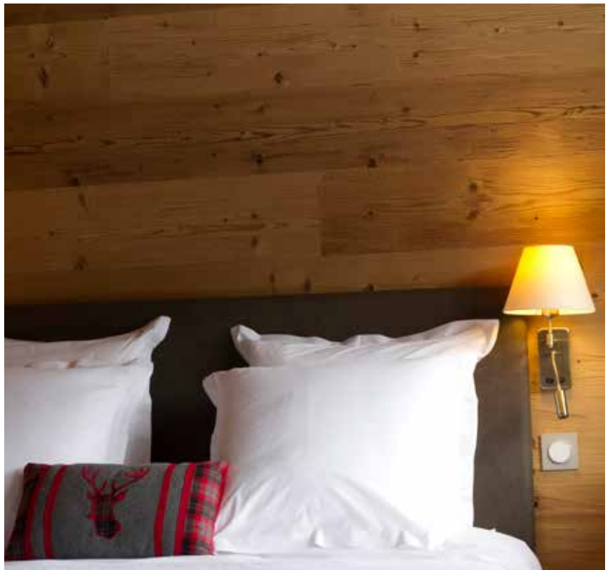
Épicéa du Nord, EcoThermo intérieur - Micro 1 - 19x210 - rustiqué La ferme d'en haut, Saint-Jean-de-Sixt (74)