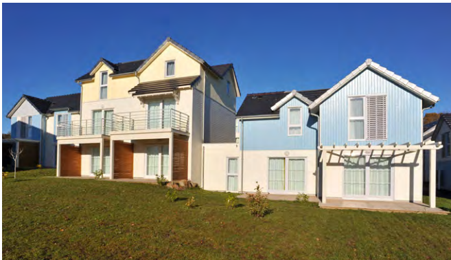
Silver Lab', Ontario - Jaune et bleu pastels Centre Pierre & Vacances - Pornichet (44)

La couleur que vous avez choisie sera développée spécialement pour vous, pour toute commande de 50 m 2 minimum*. Nous vous préconisons de commander systématiquement 10 % de bardage Silver Lab' Couleur en plus pour vos coupes et travaux de fin de chantier.