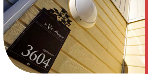
Silver Lab', Ontario - Jaune et bleu pastels