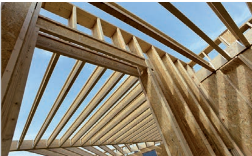
Mur et solivage en poutres en I