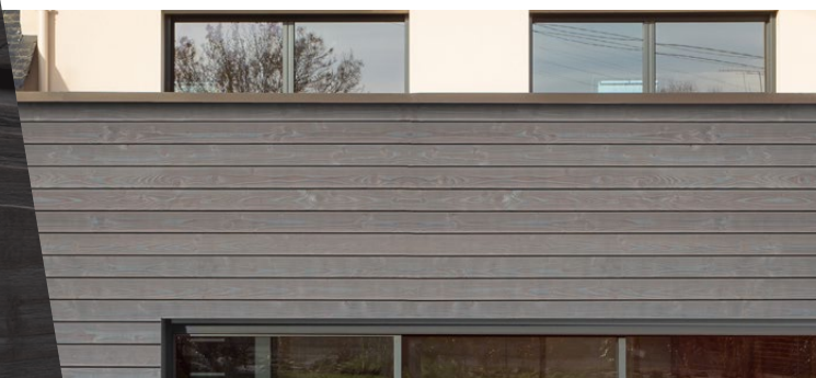
Bardage Protect Douglas, profil Line, Gris Equinox