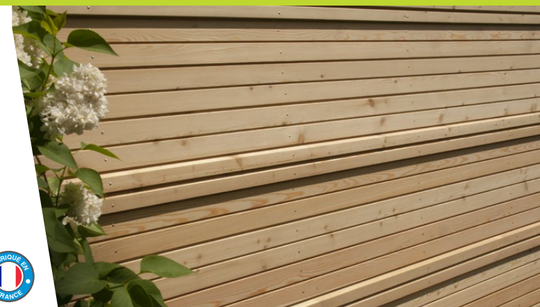
Bardage Mélèze 3D : 2 épaisseurs mixées pour créer du rythme et du relief à la façade

Retrouvez toutes nos garanties sur www.silverwood.fr