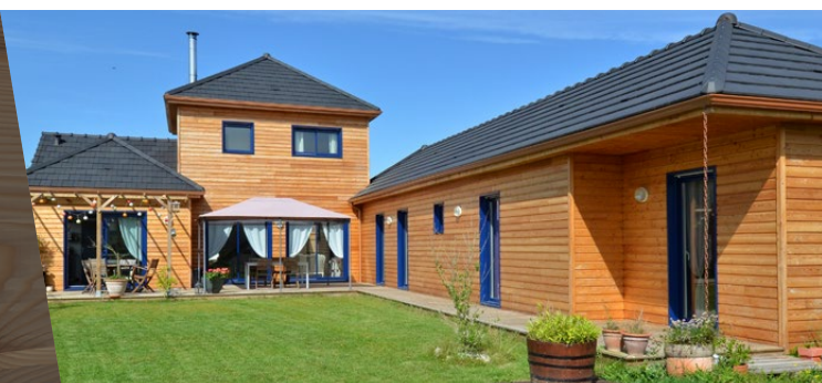
Bardage Mélèze Naturel profil Oural - Maison individuelle (28) - Constructeur : Le Drein Courgeon

*La durabilité naturelle s'entend toujours hors aubier. L'aubier nécessite une préservation.