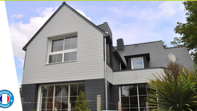
Bardage Métal Platinium et Extra Noir Onyx - Maison individuelle (44) - Architecte Allhouse

Retrouvez toutes nos garanties sur www.silverwood.fr