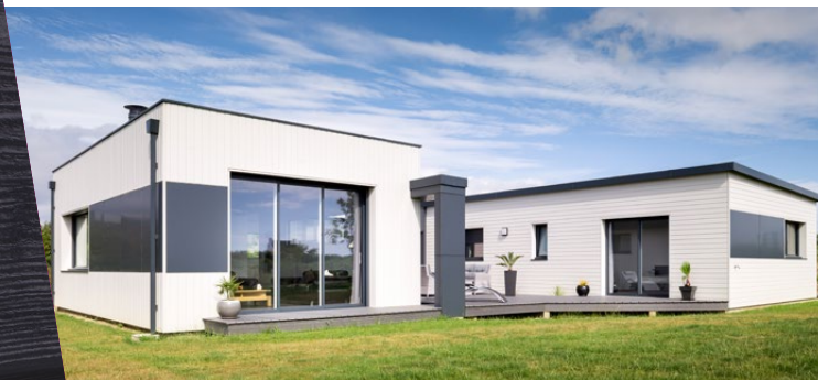
Bardage Extra Blanc, profil Ontario - Maison individuelle (29) - Constructeur : Trécobat