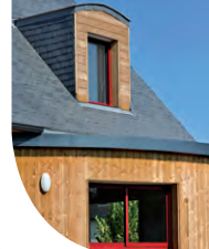
Silverwood Classic Sapin du Nord Profil Moutiers