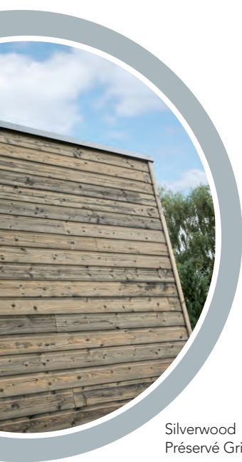
Silverwood Classic, Sapin du Nord Préservé Gris, Profil Moutiers